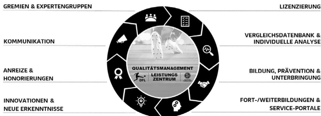
Abbildung 1: Qualitätsmanagementsystem für die Leistungszentren (Stand: Dez. 2019)

Zur Sicherung und Steigerung der Qualität der Ausbildung in den Leistungszentren haben DFL e.V. und DFB ein ganzheitliches Qualitätsmanagementsystem eingeführt (siehe Abbildung 1). Das Präsidium des DFL e.V. ist berechtigt, verbindliche Durchführungsbestimmungen für das Qualitätsmanagementsystem zu erlassen. Die Clubs der Bundesliga und 2. Bundesliga, die ein Leistungszentrum nach § 3 Nr. 2 LO unterhalten müssen, sind innerhalb dieses QM-Systems verpflichtet, am Teilbereich „Individuelle Analyse & Vergleichsdatenbank“ teilzunehmen.