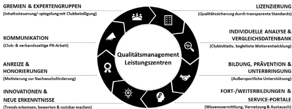
Abbildung 1: Qualitätsmanagementsystem für die Leistungszentren (Stand: Dez. 2019)

Zur Sicherung und Steigerung der Qualität der Ausbildung in den Leistungszentren haben DFL e.V. und DFB ein ganzheitliches Qualitätsmanagementsystem eingeführt (siehe Abbildung 1). Das Präsidium des DFL e.V. ist berechtigt, verbindliche Durchführungsbestimmungen für das Qualitätsmanagementsystem zu erlassen. Die Clubs der Bundesliga und 2. Bundesliga, die ein Leistungszentrum nach § 3 Nr. 2 LO unterhalten müssen, sind innerhalb dieses QM-Systems verpflichtet, am Teilbereich „Individuelle Analyse & Vergleichsdatenbank“ teilzunehmen.